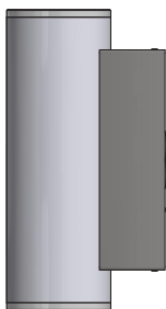
ErikLED Art.Nr. 555-4xx

Lampen er produsert med størst mulig omtanke for beskyttelse av både leverandørmiljøet og arbeidsmiljøet. Hvis de til slutt velger å bytte ut lampen, bør de forsikre dem om at den vil bli returnert for resirkulering. Emballasjen er, så langt det er mulig, resirkulerte materialer, som de bør sørge for overlevert til gjenvinning.